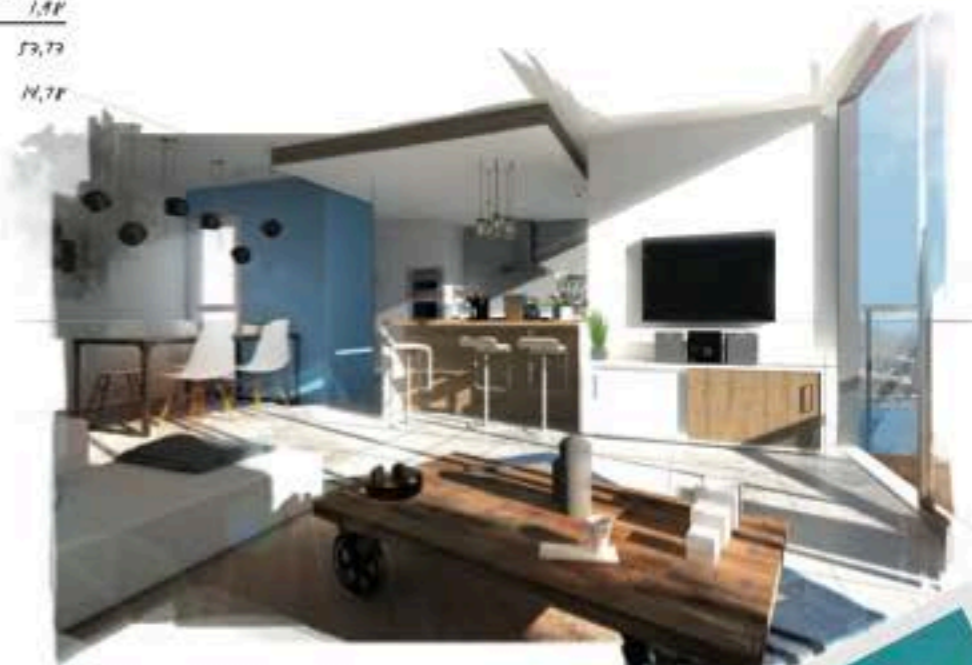
appart. F3 - vue du 15 e étage.